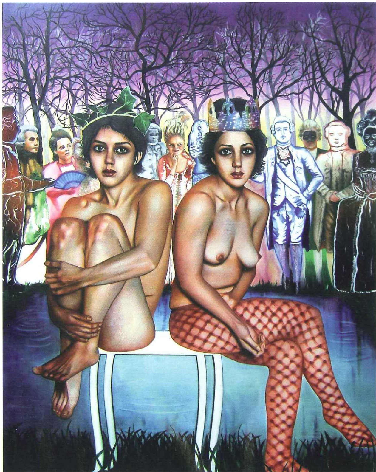
Yassaman et Nastaran 2008 Huile sur toile 162 x 130 cm

Nazanin Pouyandeh est née le 21 septembre 1981 à Téhéran, arrivée en France à l'âge de 18 ans. 2005 : Diplôme de l'École Nationale Supérieure des Beaux-Arts de Paris (Atelier de Pat Andrea). 2007 : Master 2 recherche Arts plastiques - Université Paris I. Expositions personnelles : 2007 : Fonds d'Art moderne et contemporain de Montluçon. 2005 : Galerie Gauche - ENSBA à Paris. 2004 : Galerie des Beaux-Arts (CROUS) à Paris. 2003 : Galerie Gauche - ENSBA à Paris. 2002 : Cité des arts à Paris. Expositions collectives : 2008 : 12 e prix Antoine Marin à Arcueil, Galerie Victor Saaverdra à Barcelone, « La nouvelle histoire » autour de Pat Andrea - Centre d'art contemporain à Mont de Marsan. 2007 : Galerie Aeroplastics à Bruxelles, Biennale du Salon Jeune Création Européenne - Salon de Montrouge, « La nouvelle histoire » autour de de Pat Andrea - Pulchri Studio à La Haye, Art Amsterdam - Galerie Hors sol, Art Paris - Galerie Claire Gastaud - Clermont-Ferrand. 2006 : Biennale de Jeune Création à Bourges, Salon des jeunes Créateurs (H2O) au Centre Culturel Valéry Larbaud à Vichy, Salon de Montrouge, Galerie Frissiras à Athènes, « Novembre à Vitry » à la Galerie Municipale à Vitry-sur-Seine.