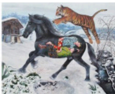
Nazanin Pouyandeh, Les Sibériens en voyage , 2014 Courtesy de l'artiste et galerie Sator, Paris

maisons, ont beau rappeler une exigence figurative, ils n'ont rien à voir avec la réalité physique que l'on côtoie. Là, se tient un monde déguisé. Aux contours auréolés de mythes, de contes, de fables. Aussi la plasticienne fait-elle de la représentation une fresque intérieure où circulent des histoires qui n'appartiennent qu'à elle. Et pour basculer dans ses chimères heureuses, il suffit d'être attentif à l'absence de perspective. C'est donc dans la peinture qu'il faut être et non devant. Entrer dans son univers, c'est se confronter à un art naïf qui cultive les figures enfantines.